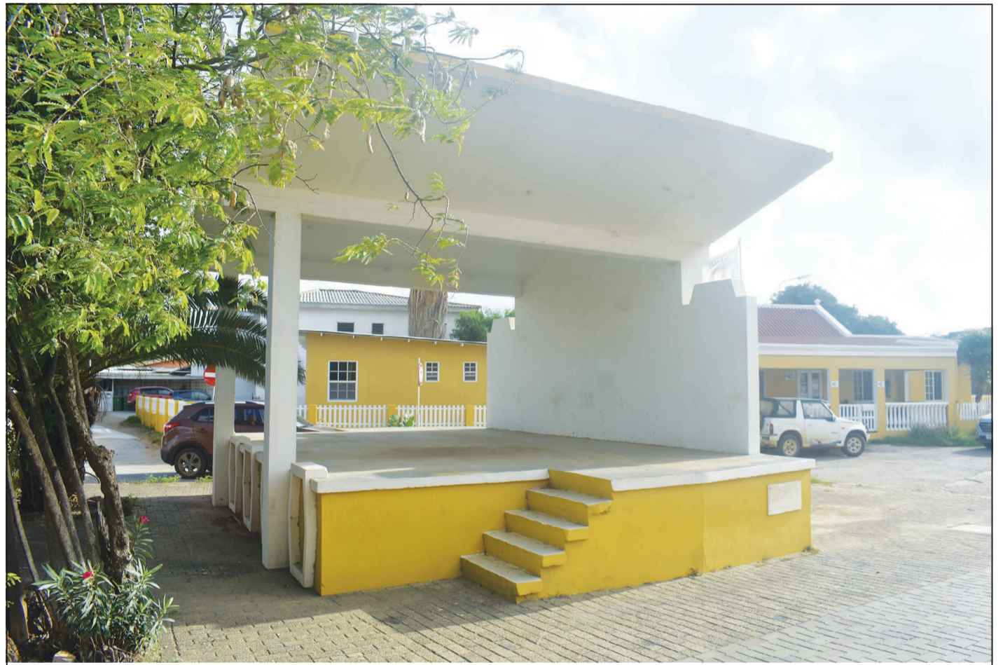
E kiosko ku a traha pa nort di Misa San Bernardo, awor Plasa Fraternan di Tilburg.